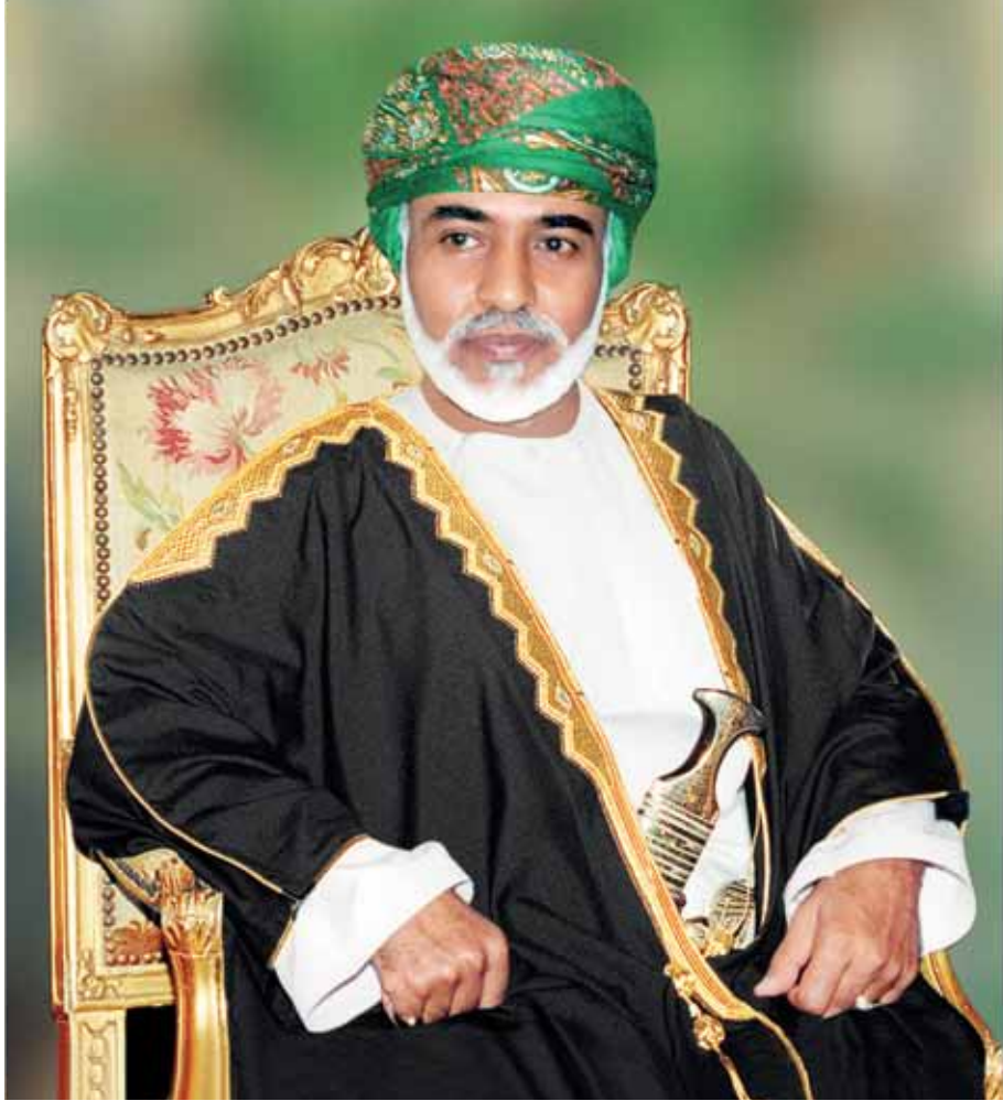
حفيفة صاهين الجلالة السلطان فابوس بن سعيد المعظم - حفيلة الله ورحاه