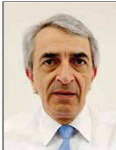
الفاضل / محموت تايفون انك